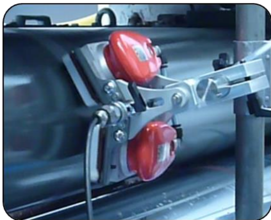
高温洗浄剤の供給とソリュブル迅速洗浄 コントロールパネルで自動搬送システム