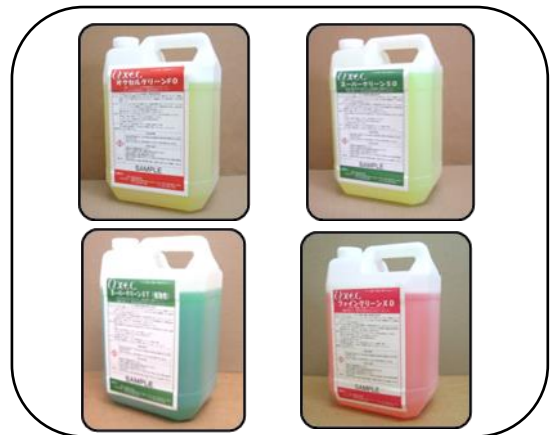
薬剤洗浄法の最高のパートナー 被印刷体に適正な高性能洗浄剤の選択