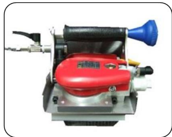
高速音波洗浄 10,000 回転で迅速洗浄 ニューオートスクラバー・擦るW型で自動化